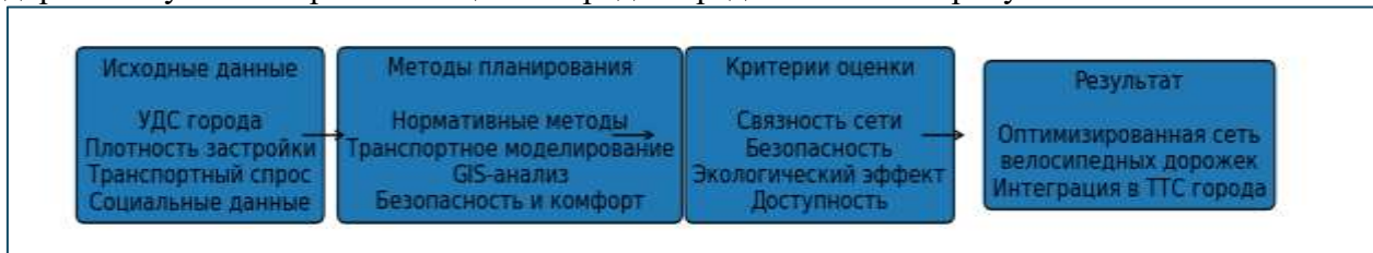
Рисунок 2. Концептуальная схема планирования сети велосипедных дорожек в условиях развивающихся городов

Обобщённая структура и взаимосвязь методов планирования сети велосипедных дорожек в условиях развивающихся городов представлены на “рисунке 2”.